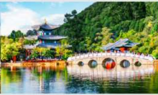
สระมิงกรดำ