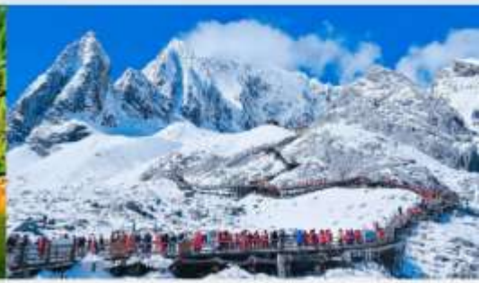
ภูเขาหิมะมิงกรหยก