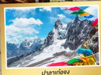
ปาลาก่องจ