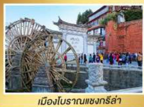
เมืองโบราณแชงกรี่ล่า