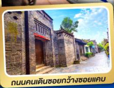
ถนนคนเดินชอยกวางชอยแคบ