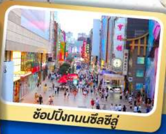
ช้อปปิ้งถนนซิลชีลู