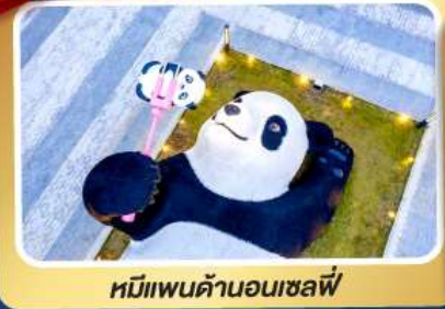
หมีแพนด้าอนเซลฟี