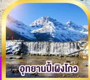
อุทยานป่าเผิงโกว