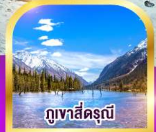
ภูเขาสัตว์รุณี