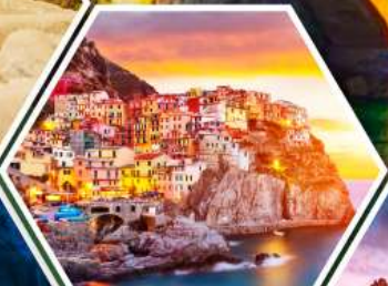
หมู่บ้านมานาโรลา