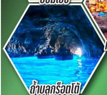
ถ้ำบลูกร็อตโต้