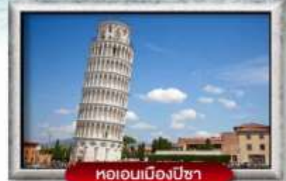
หอเอนเมืองปิซา

พิเศษ! สปาเกรดดีเส้นหมึกดำ, พิซซ่าสโตร์อิตาลีเย็นแท้