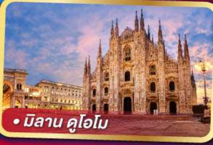
• มิลาน ดูโอโม