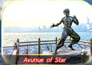
Avunue of Star