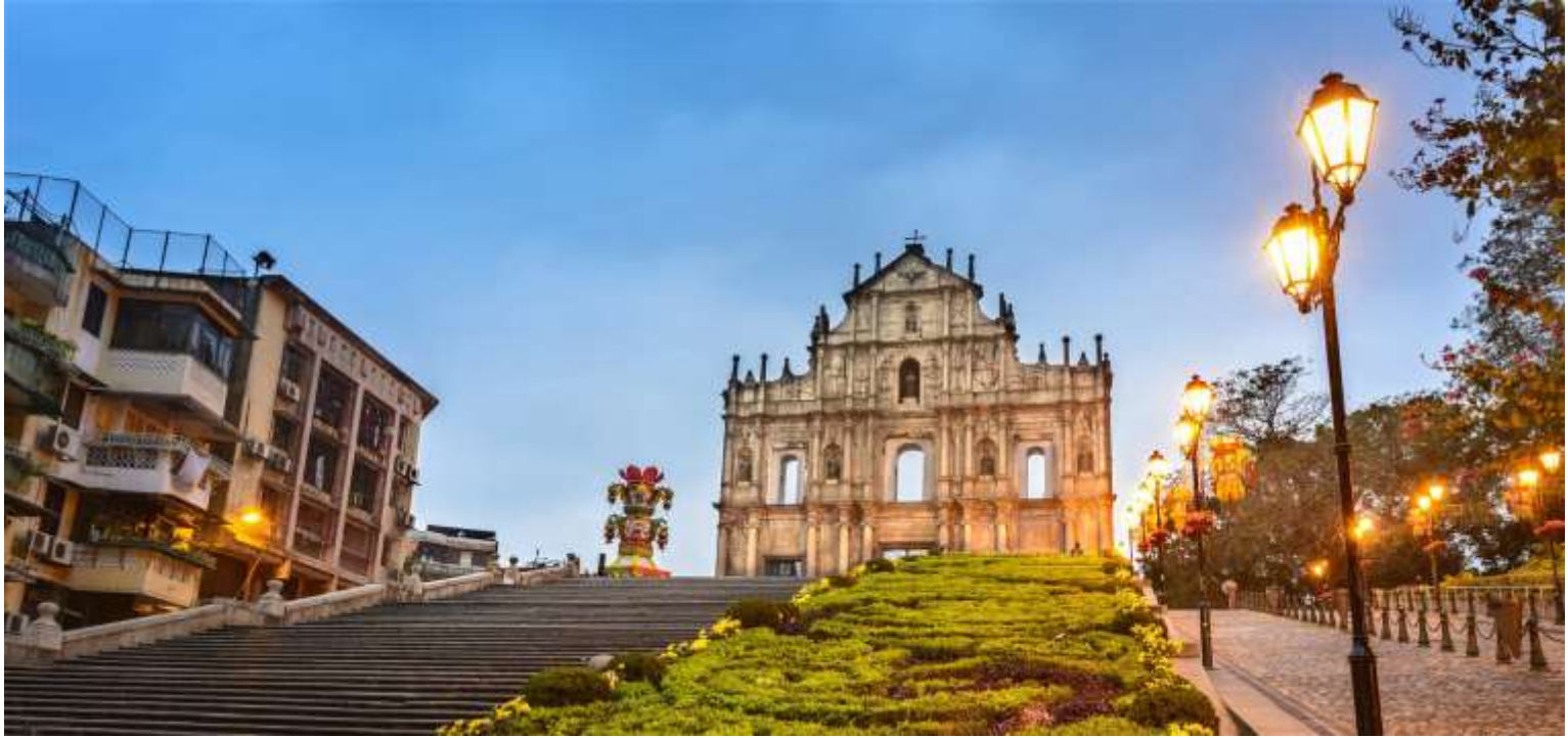
วิหารเซนต์ปอล

ออกแบบโดยสถาปนิกชาวอิตาลี ด้านหลังของโบสถ์มีพิพิธภัณฑ์จัดแสดงประวัติศาสตร์ของโบสถ์แห่งนี้ไว้ โบสถ์เซนต์ปอลได้รับการยกย่องให้เป็นอนุสาวรีย์แห่งศาสนาคริสต์ที่ยิ่งใหญ่ที่สุดในดินแดนตะวันออกไกล