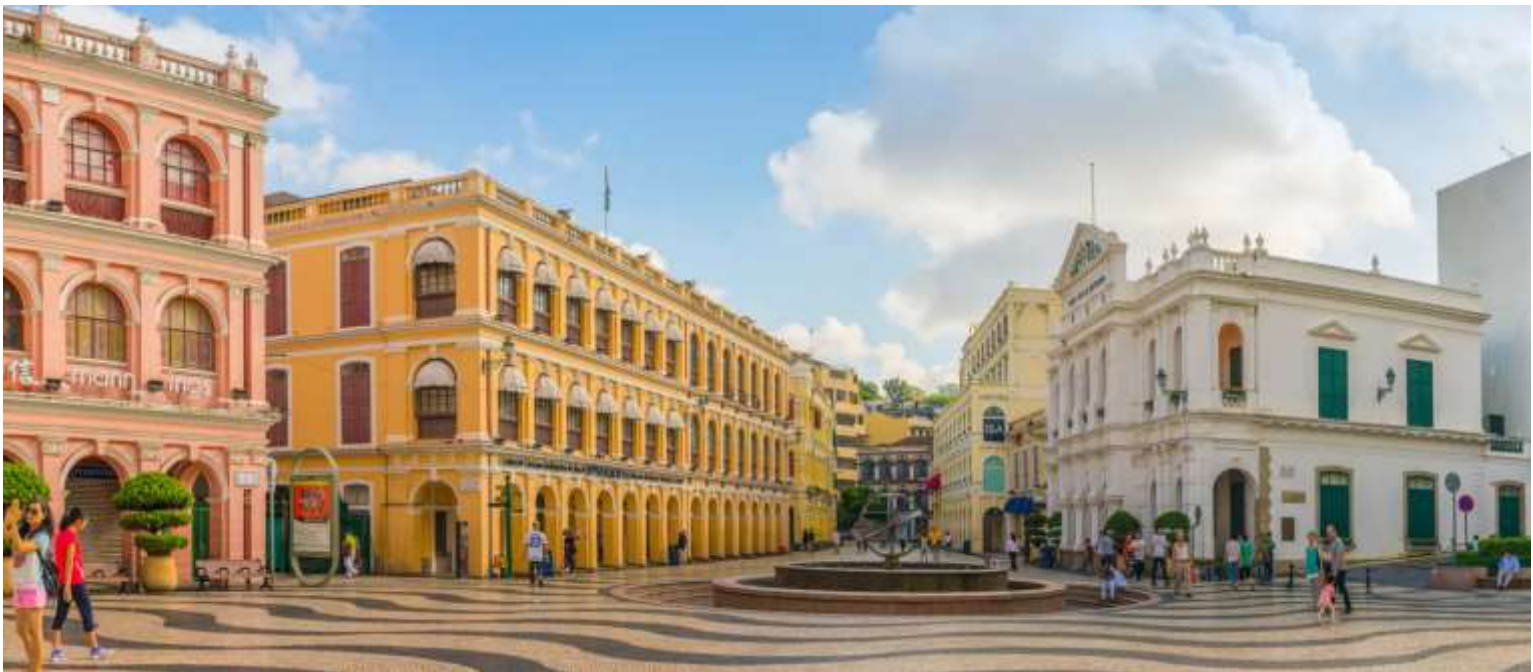
เซนาโต้ สแควร์ SENADO SQUARE

ออกแบบโดยสถาปนิกชาวอิตาลี ด้านหลังของโบสถ์มีพิพิธภัณฑ์จัดแสดงประวัติศาสตร์ของโบสถ์แห่งนี้ไว้ โบสถ์เซนต์ปอลได้รับการยกย่องให้เป็นอนุสาวรีย์แห่งศาสนาคริสต์ที่ยิ่งใหญ่ที่สุดในดินแดนตะวันออกไกล