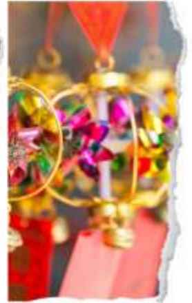
วัดแขกหมิว

นำท่านขอพรเพื่อเป็นสิริมงคล วัดแห่งนี้เป็นวัดที่คนฮ่องกงให้การเคารพนับถือเป็นอย่างมาก เป็นวัดเก่าแก่และมีชื่อเสียงที่สุดวัดหนึ่งของฮ่องกง เป็น 1 ในวัดของฮ่องกงที่ทุกท่านห้ามพลาดเลยก็เดียว