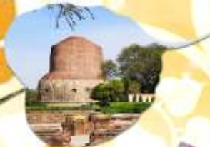
सारนาถ สถานที่ปฐมเทศนา