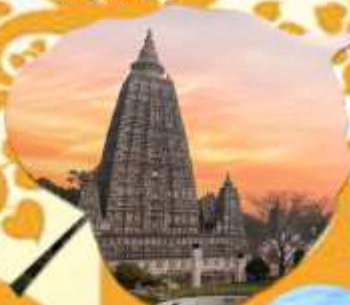
พุทธคยา สถานที่ตรัสรู้