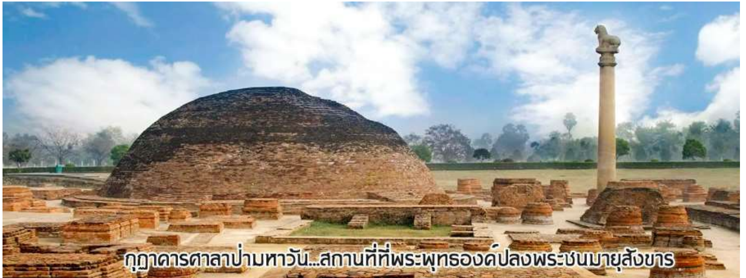
กุฎาคารศาลาป่ามหารวัน...สถานที่ที่พระพุทธองค์ปลงพระชนมายุสังขาร

นำท่านเดินทางต่อสู่เมือง กุสินารา (เดินทางประมาณ 4 ชั่วโมง)เมื่อถึงกุสินาราแล้วเดินทาง ไป วัดไทยกุสินาราเฉลิมราชย์ วัดนี้สร้างขึ้นเพื่อน้อมเป็นพุทธบูชาและเฉลิมพระเกียรติ พระบาทสมเด็จพระเจ้าอยู่หัวในวาระครองสิริราชสมบัติครบ 50 ปี และเฉลิมพระชนมพรรษา ครบ 6 รอบ 72 พรรษา พระบาทสมเด็จพระเจ้าอยู่หัวพระราชทานชื่อวัดให้ เชิญท่านร่วม ทำบุญตามกำลังศรัทธา