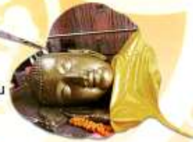
กุสินารา สถานที่ประสูติพพาน