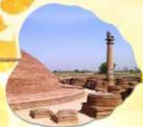
โวลาลี เมืองหลวงแคว้นอานาจักรวัชชี แคว้นชมพูทวีป