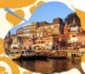
พาราณสี เมืองหลวงทางจิตวิญญาณภาคอินเดีย