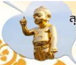
ลุมพินี สถานที่ประสูติ