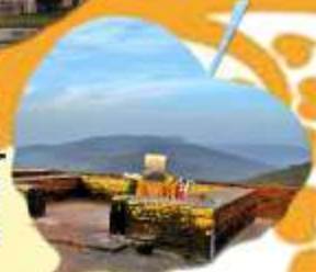
ราชคฤห์ เมืองหลวงแคว้นมคธ