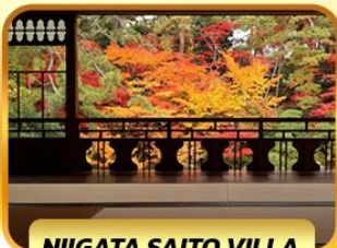
NIIGATA SAITO VILLA