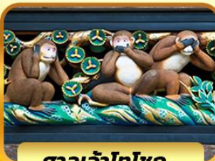
ศาลเจ้าโทโฮกุ