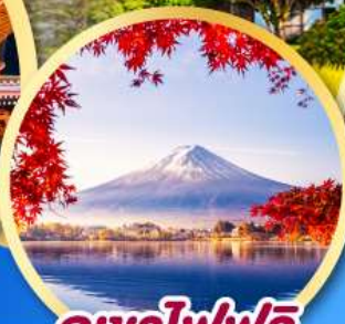
ภูเขาไฟฟูจิ