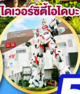
โดเวอร์ซิตี ไอโดะ