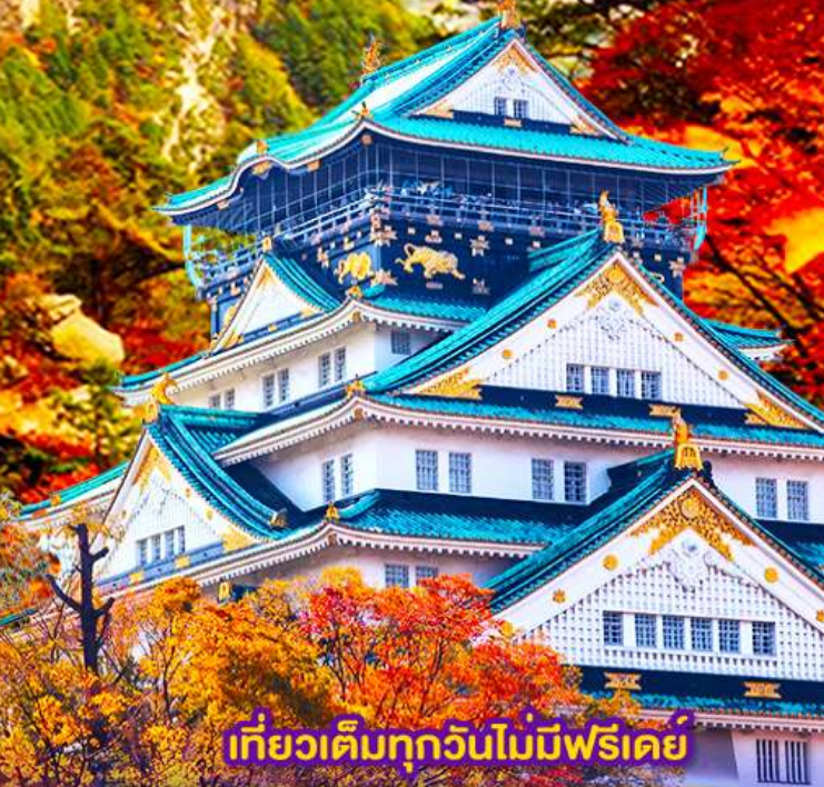
เที่ยวเต็มทุกวันไม่มีฟรีเดย์