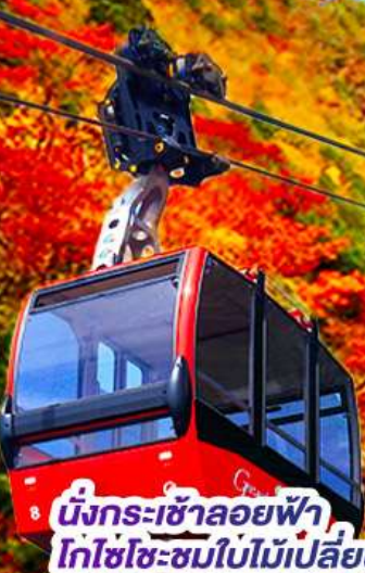
นั่งกระเช้าลอยฟ้า โกโซโซะชมใบไม้เปลี่ยนสี