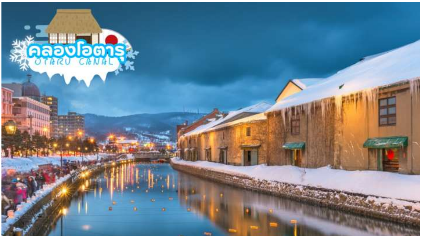
เดินทางสู่ เมืองโอตารุ (Otaru) เป็นเมืองท่าสำคัญสำหรับซัปโปโร นำท่านชม คลองโอตารุ (Otaru Canal) ที่มีความยาว 1.5 กิโลเมตร ถือเป็นสัญลักษณ์ของเมืองโอตารุ โดยมีโกดังเก่าบริเวณโดยรอบ