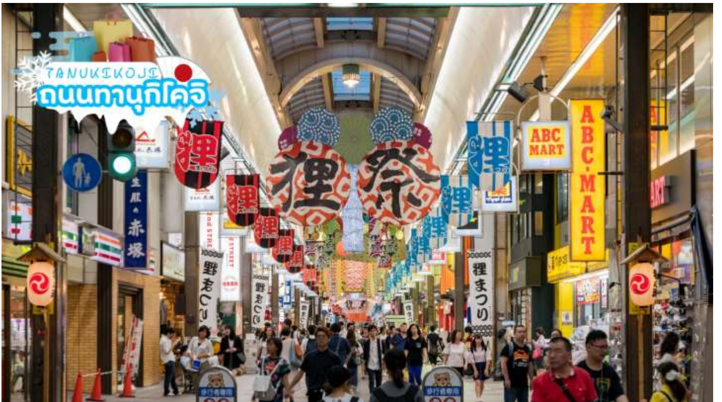
นำท่านเดินทางสู่เมืองซัปโปโร ช้อปปิ้ง ถนนทานุกิโคจิ (Tanukikoji) เป็นย่านช้อปปิ้งเก่าแก่ที่เปิดให้บริการยาวนานกว่า 100 ปี จุดเด่นของย่านนี้ คือ การสร้างหลังคาที่คลุมทั่วตลาด ไม่ว่าจะฝนตก