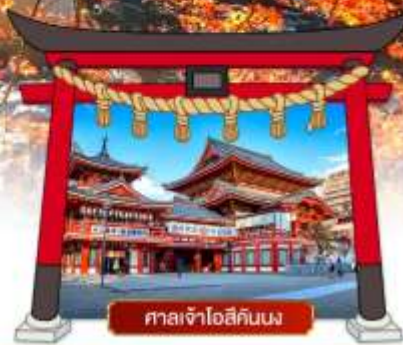
ศาลเจ้าโอสึคินนง