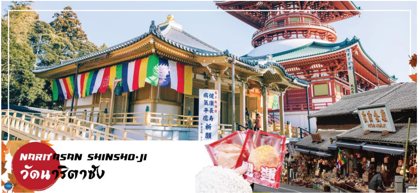
NARITASAN SHINSHO-JI วัดนาริตะชิน