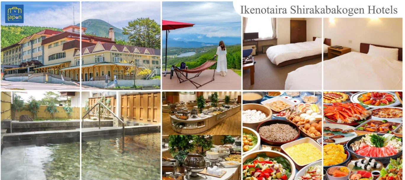
Ikenotaira Shirakabakogen Hotels

หลังอาหารให้ท่านได้ผ่อนคลายกับการแช่น้ำแร่ธรรมชาติ เชื่อว่าถ้าได้แช่น้ำแร่แล้ว จะทำให้ ผิวพรรณสวยงามและช่วยให้ระบบหมุนเวียนโลหิตดีขึ้น