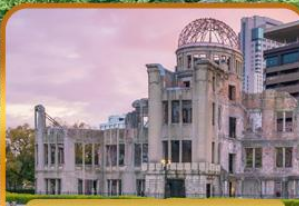
อะตอมบิคอมบิโดม