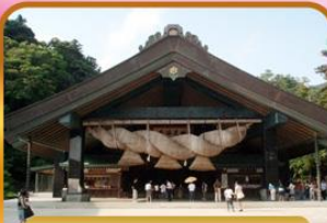
ศาลเจ้าอิซุโมะโทวะ