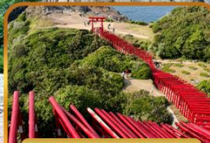
ศาลเจ้าโมโตโนสุมิฮาริ