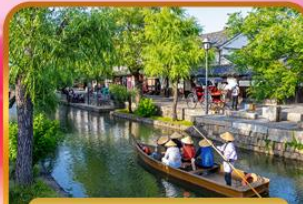
เขตอนุรักษ์คุราซึกิ