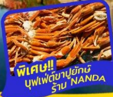
พิเศษ!! บุฟเฟ่ต์ปูยักษ์ รับประทานอาหาร NANDA