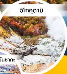
จิโศกุดานิ