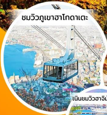
ชมวิวกุเอฮาโกดาเตะ