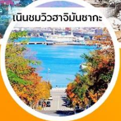
เนินชมวิวจาจินซากะ