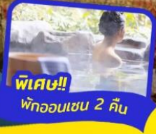
พิเศษ!! พักออนเซน 2 คืน