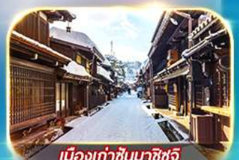
เมืองเก่าซันมาชิซูจิ