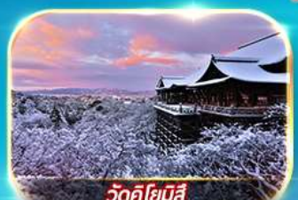
วัดคิโยมิตสึ