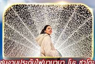
ชมงานประดับไฟนาบานา โนะ ซาโตะ