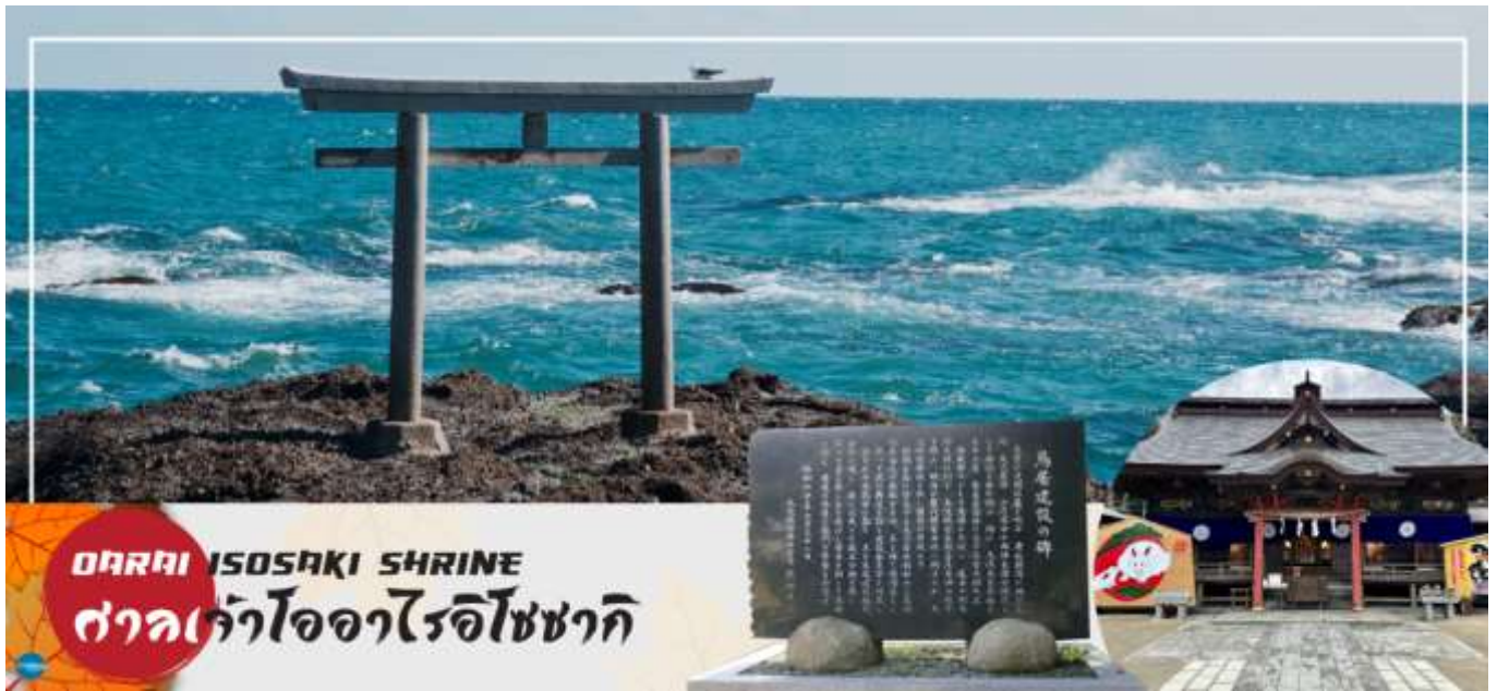
OARAI ISOSAKI SHRINE ศาลเจ้าโองาไรอิโซซากิ