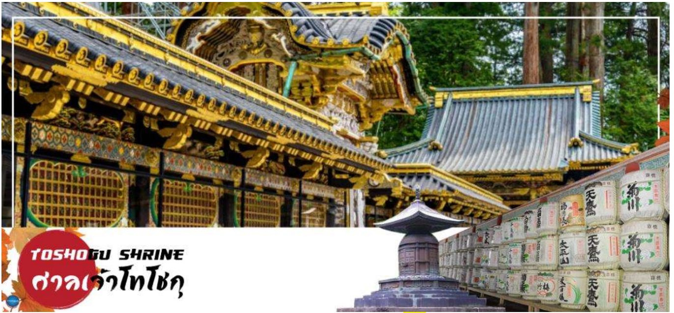
TOSHOGU SHRINE ศาลเจ้าโทโชกุ

เมืองนิกโกะ – ผ่านชม สะพานชินเคียว – ศาลเจ้าโทโชกุ – ศาลเจ้าฟุตาระ – จังหวัดไซตามะ – ย่านเมืองเก่าคาวะโกเอะ – ดรอกลูกกวาด – เมืองยามานาชิ – ออนเซ็น + ชาบูยักษ์