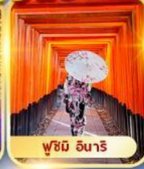
ฟูชิมิ อินาริ