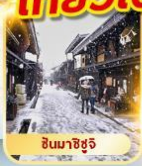
ชินมาชิซุจิ