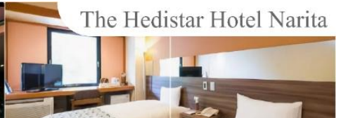
The Hedistar Hotel Narita