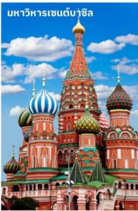
มหาวิหารเซนต์บาซิล

นำท่านถ่ายรูปด้านหน้า มหาวิหารเซนต์บาซิล สร้างในสมัยพระเจ้าอิวานที่ 4 จอมโหด ศิลปะเป็น แบบรัสเซียโบราณ ประกอบด้วยยอดโดม 9 ยอด เพื่อเป็นอนุสรณ์มีชัยชนะในสงคราม ที่มีชัยเหนือพวกมองโกลอย่างเด็ดขาด