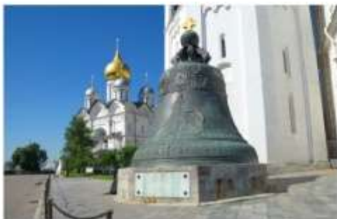
ระบั้งพระเจ้าซาร์

สร้างในสมัยพระนางแอนนาที่ทรงประสงค์จะสร้างระบั้งใบใหญ่ที่สุดในโลกเพื่อนำไปติดตั้งบนหอรบั้ง แต่เนื่องจากมีความผิดพลาดจึงทำให้ระบั้งแตกออก