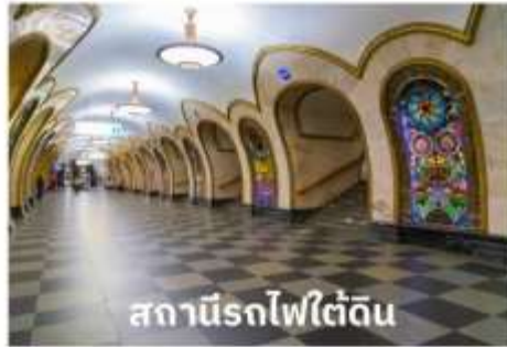
สถานีรถไฟใต้ดิน

บริการอาหารเช้า ณ ห้องอาหารของโรงแรม นำท่านเที่ยวชม สถานีรถไฟใต้ดิน ที่ใครมามอสโกจะต้องได้ลองนั่งรถไฟใต้ดินดูสักครั้ง