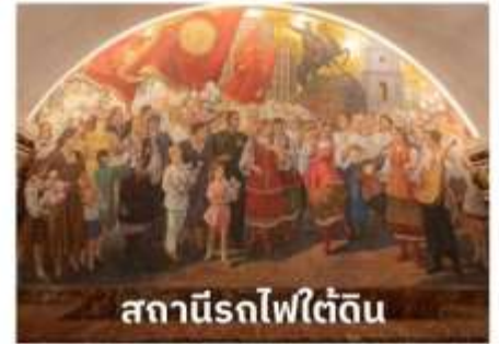
สถานีรถไฟใต้ดิน

เพราะนอกจากจะมีสถานีรถไฟใต้ดินที่สวยงามที่สุดในโลกแล้วยังมีความลึกมากอีกด้วย รถไฟใต้ดินทำให้ผู้คนสามารถเดินทางไปไหนมาไหนได้สะดวกกว่าบนถนนทั่วไป สถานีรถไฟใต้ดินเป็นสิ่งก่อสร้างที่ชาวรัสเซียสามารถอวดชาวต่างชาติให้เห็นถึงความยิ่งใหญ่ ตลอดจนประวัติศาสตร์ความเป็นชาตินิยมและวัฒนธรรมประเพณีอันสวยงาม เป็นเสน่ห์ดึงดูดให้นักท่องเที่ยวมาเยี่ยมชมเนื่องจากการตกแต่งของแต่ละสถานี มีความแตกต่างกันด้วยประติมากรรม โคมไฟระย้า เครื่องแก้ว หินแกรนิต และหินอ่อน เป็นต้น