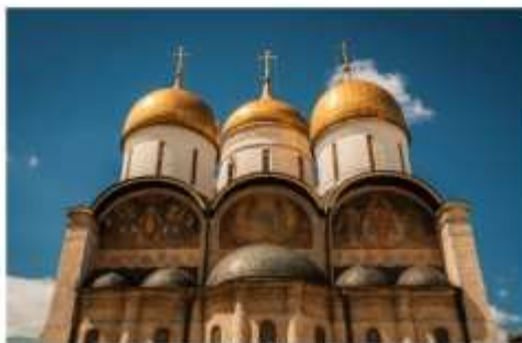
โบสถ์อัสสัมชัญ