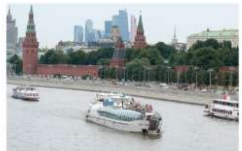
ล่องเรือแม่น้ำมอสโก