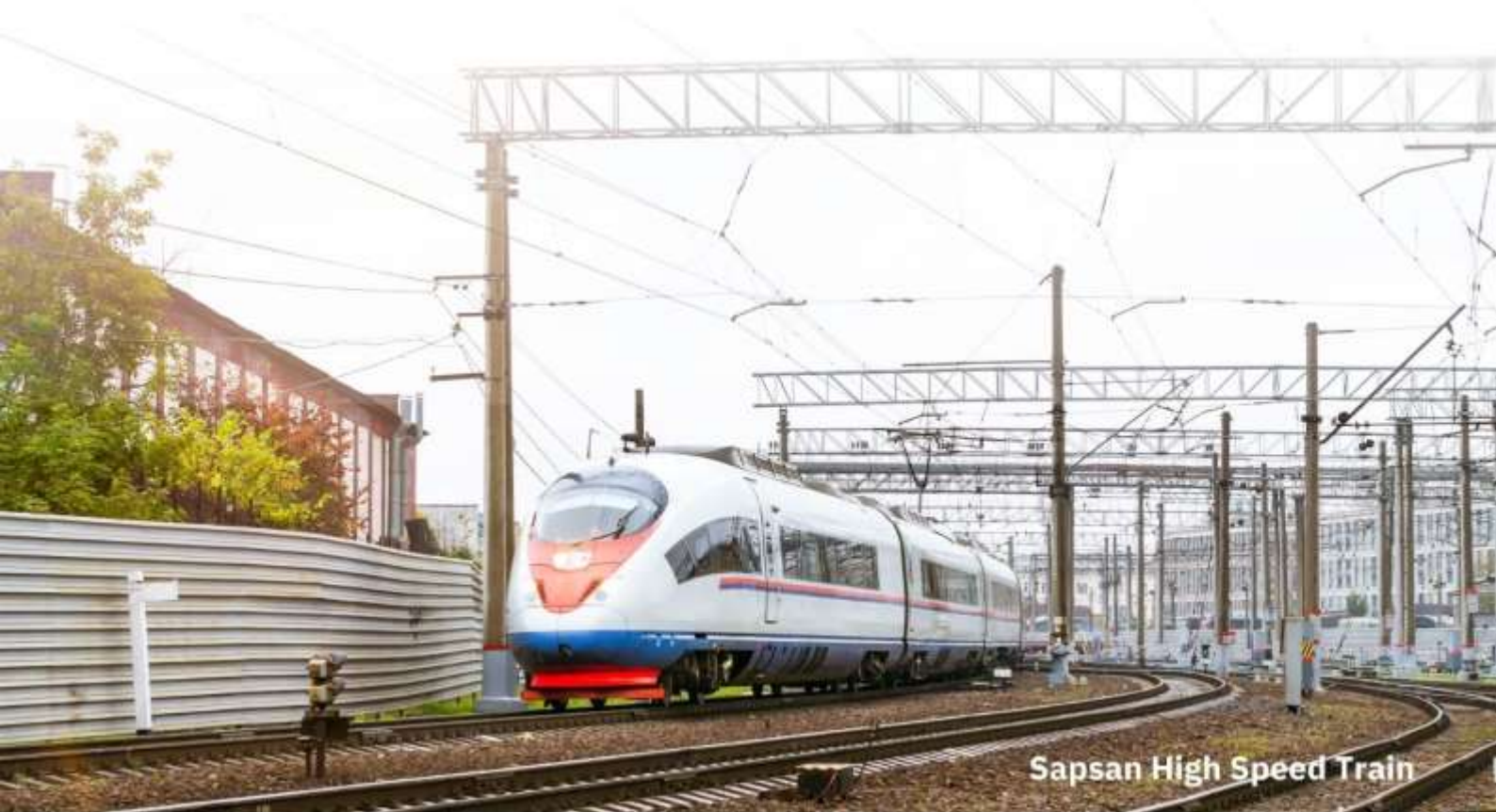
Sapsan High Speed Train

และนำท่านเดินทางสู่สถานีรถไฟเพื่อเตรียมตัวเดินทางไปยัง เมืองเซ็นตีปีเตอร์สเบิร์ก ออกเดินทางสู่ เมืองเซ็นตีปีเตอร์สเบิร์ก โดยรถไฟด่วน SAPSAN เทคโนโลยีใหม่ล่าสุดจากเยอรมัน ใช้เวลาเพียง 4 ชั่วโมงจากกรุงมอสโกว์สู่ไปเซ็นตีปีเตอร์สเบิร์ก ระยะทางประมาณ 800 กม.