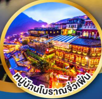
หมู่บ้านโบราณฉิวเฟิ่น