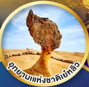
อุทยานแห่งชาติเย้หลิว