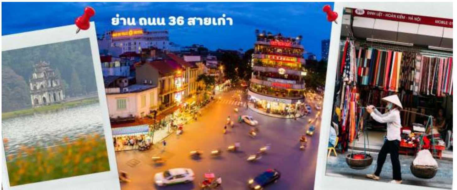
ย่าน ถนน 36 สายเก่า

จากนั้นให้ท่านได้ อิสระช้อปปิ้ง ถนนสาย 36 street แหล่งช้อปปิ้งของसानอย มีต้นไม้ปกคลุมสองฝั่งถนน สาเหตุที่ชื่อถนน 36 มาจาก 36 อาชีพที่ทำการค้าขายบนถนนแห่งนี้ ตั้งแต่อดีตอย่างงานด้านหัตถกรรมสอดคล้องกับชื่อถนนแต่ปะเส้น ในอดีตอย่าง เครื่องเงิน ผ้าไหม บนถนนแห่งนี้ แต่ปัจจุบันมากกว่า 36 ไปแล้ว ที่นี้จะเป็นแหล่ง Shopping มีสินค้าเกือบทุกชนิด ร้านขายชุดกีฬาทุกแบรนด์เพราะที่นี้เป็นแหล่งผลิตให้หลาย ๆ แบรนด์