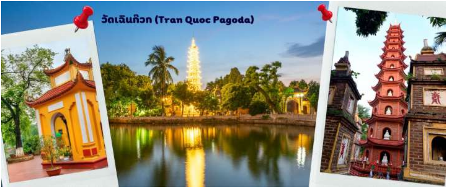
วัดเลนทิว (Tran Quoc Pagoda)

จากนั้นให้ท่านได้ อิสระช้อปปิ้ง ถนนสาย 36 street แหล่งช้อปปิ้งของसानอย มีต้นไม้ปกคลุมสองฝั่งถนน สาเหตุที่ชื่อถนน 36 มาจาก 36 อาชีพที่ทำการค้าขายบนถนนแห่งนี้ ตั้งแต่อดีตอย่างงานด้านหัตถกรรมสอดคล้องกับชื่อถนนแต่ปะเส้น ในอดีตอย่าง เครื่องเงิน ผ้าไหม บนถนนแห่งนี้ แต่ปัจจุบันมากกว่า 36 ไปแล้ว ที่นี้จะเป็นแหล่ง Shopping มีสินค้าเกือบทุกชนิด ร้านขายชุดกีฬาทุกแบรนด์เพราะที่นี้เป็นแหล่งผลิตให้หลาย ๆ แบรนด์