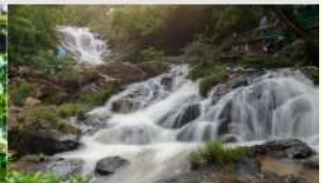
น้ำตกดาตันลา

*ทางบริษัทฯ ขอสงวนสิทธิ์ในการสลับโปรแกรมทัวร์ตามความเหมาะสมขึ้นอยู่กับสถานการณ์หน้างาน โดยคำนึงถึงผลประโยชน์ของลูกค้าเป็นสำคัญ