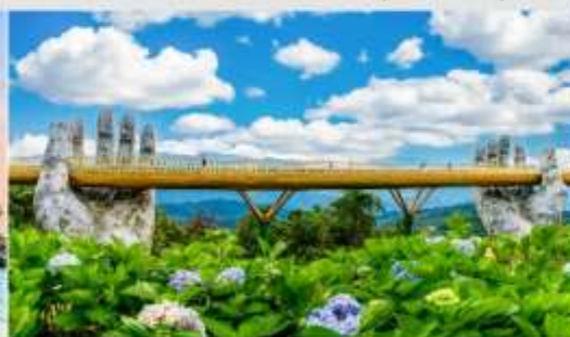
สะพานโกเด็นบริดจ์