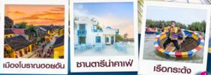
เมืองโบราณฮอยอัน ซานทริน่าคาเฟ่ เรือกระดัง

CVZD10 Vietjet Airline บินจ่ายกลับเย็น PREMIUM Quality Traveler