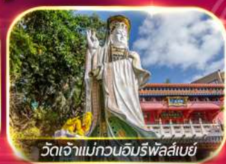
วัดเจ้าแม่กวนอิมรัฟลัสเบย์