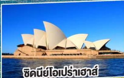
ซิดนีย์โอเปร่าเฮาส์