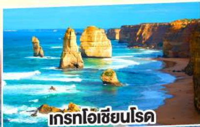
เกรทโอเชียนโรด