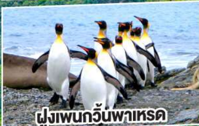
ฝูงเพนกวินพาเหรด