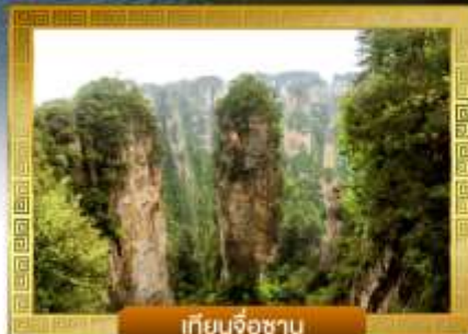
เทียนจื่อชาน