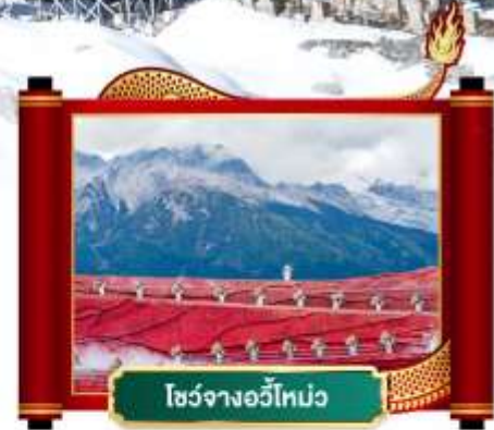
โชว์จางอวี่ไห่หม่ว