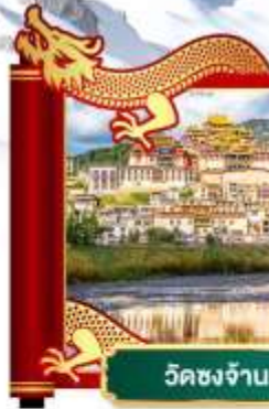
วัดชงจ้านหลิน