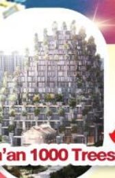
วัดพระหยกขาว ถนนนานกิง Tian'an 1000 Trees