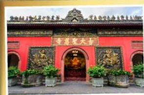
วัดต้าอี