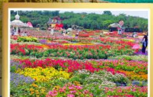
สวนสวรรค์แห่งดอกไม้ Manhua Manor