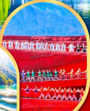
โชว์ Impression Lijiang