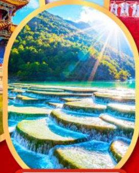
คุบเขาสั้่น้ำเงิน