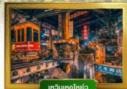
เหวินเทอโฮ่ย