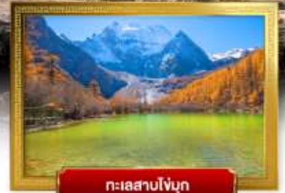
ทะเลสาบไ้ญุก