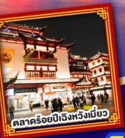
ตลาดร้อยปีเจิ้งหวิงเมี่ยว