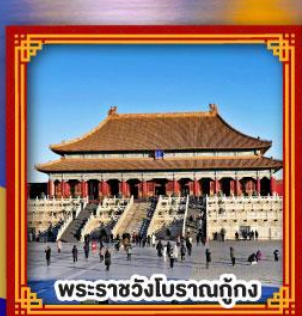
พระราชวังโบราณกู้กง