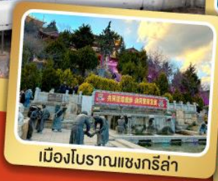
เมืองโบราณแชงกรีล่า