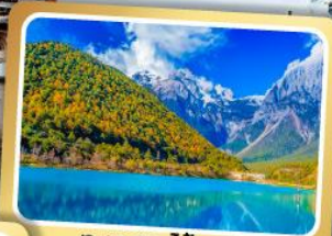
ทะเลสาบไป๋สือเหอ