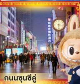
ถนนชุนซีลู่