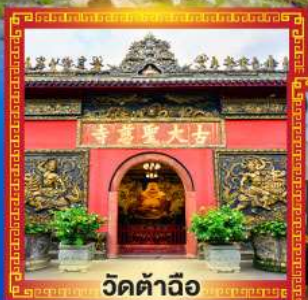
วัดต้าอิว