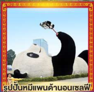
รูปปั้นหมีแพนด้านอนเซลฟ์