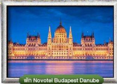
พัก Novotel Budapest Danube