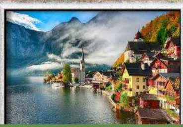
พัก Hallstatt / St. Wolfgang หรือริมนทะเลสาบ 1 คืน

พิเศษ!! ลิ้มลองเมนูประจำชาติ ทั้ง 5 ประเทศ!!!