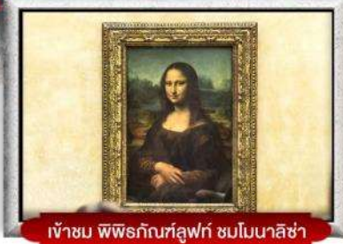
เข้าชม พิพิธภัณฑ์ลูฟวร์ ชมโมนาลิซ่า