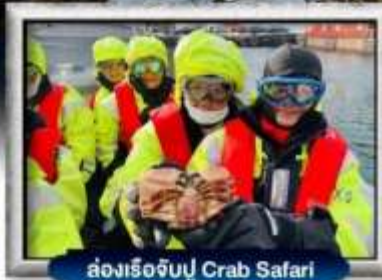
ล่องเรือจับปู Crab Safari