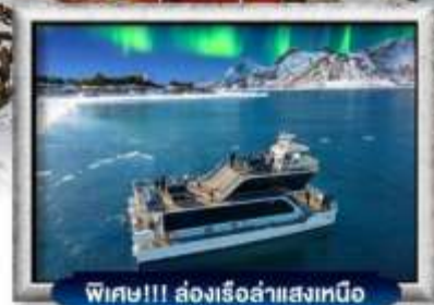
พิเศษ!!! ล่องเรือลำแสงเหนือ

บินทรู สายการบิน Full Service | พิเศษ! ไข่ปู King Crab