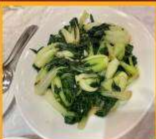
ผัดผักตามฤดูกาล