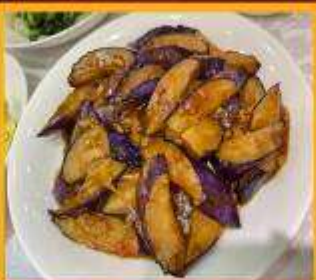
มะเขืออบหม้อดิน