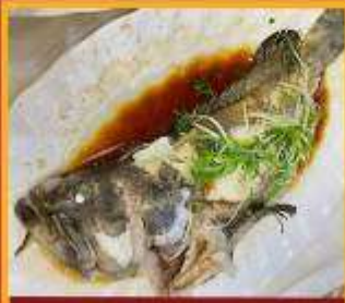
ปลาหนึ่งซีอิ๊ว