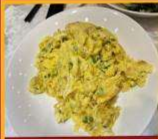
ไข่เจียวทรงเครื่อง