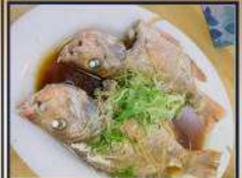
ปลาหนึ่งซีอิ๊ว