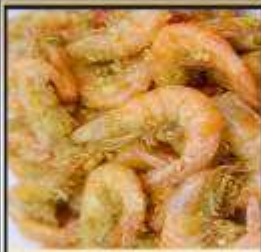
กุ้งทอดกระเทียม