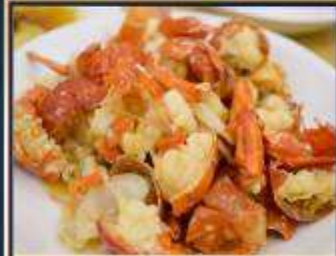
กุ้งมังกรอบซีส