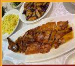
ท่านอย่าง