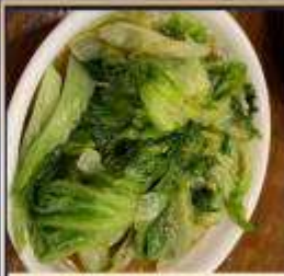
ผัดผักตามฤดูกาล