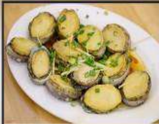
เปาฮื้อสดหนึ่ง