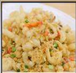
หมึกทอดกระเทียม