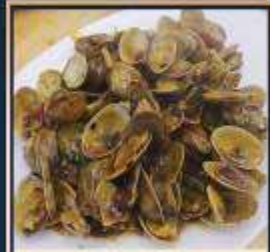
ผัดหอยลาย