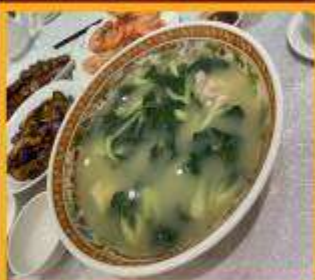
ซุปลวกใส่หมู