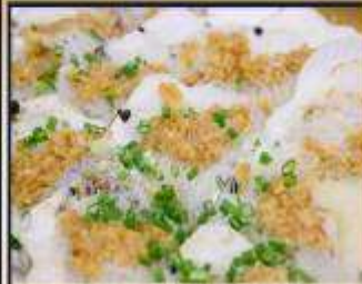
หอยเชลล์อบวุ้นเส้น