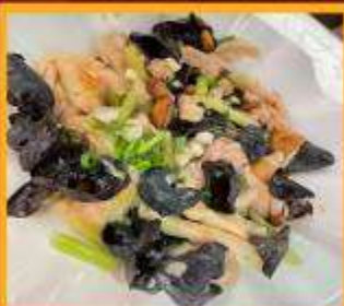
ไก่ผัดเห็ดทูทนู