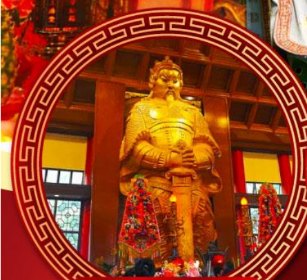
วัดเขangkงหมิว