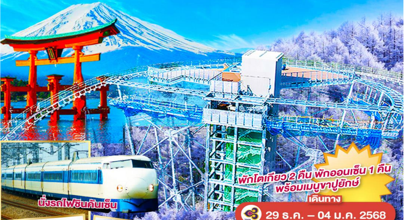
นั่งรถไฟชินคันเซ็น

พักโตเกียว 2 คืน พักออนเซ็น 1 คืน พร้อมเมนูญี่ปุ่น เดินทาง