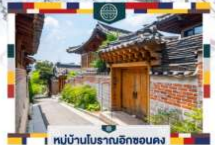
หมู่บ้านโบราณฮงแด