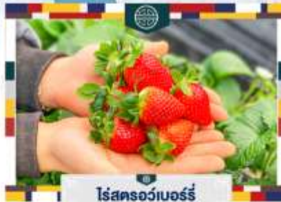
ไร่สตรอว์เบอร์รี่