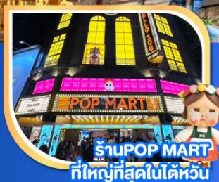
ร้านPOP MART ที่ใหญ่ที่สุดในโลก