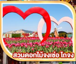
สวนดอกไม้เมืองเซ่ ใจจง