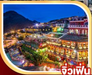
จีวเฟิ่น